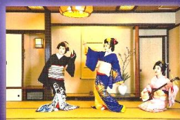
下田伝統芸能普及促進委員会 協力：下田芸者 舞家